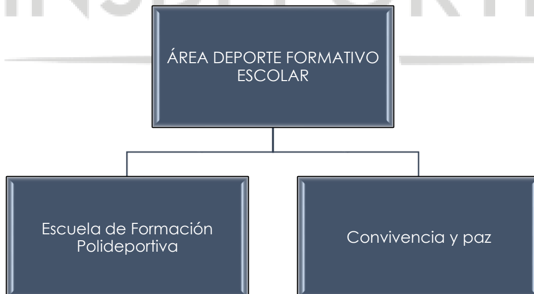
Ilustración 5- PROGRAMAS DEL ÁREA DE DEPORTE FORMATIVO ESCOLAR

El Área de Deporte Formativo Escolar en atención a lo dispuesto mediante el Acuerdo de Junta Directiva N° 002 del 5 de agosto 2021 "Por la cual se ajusta la estructura orgánica y se adoptan los procesos misionales del Instituto Municipal de Deportes y Recreación de Cajicá", se adoptan los programas a desarrollar.