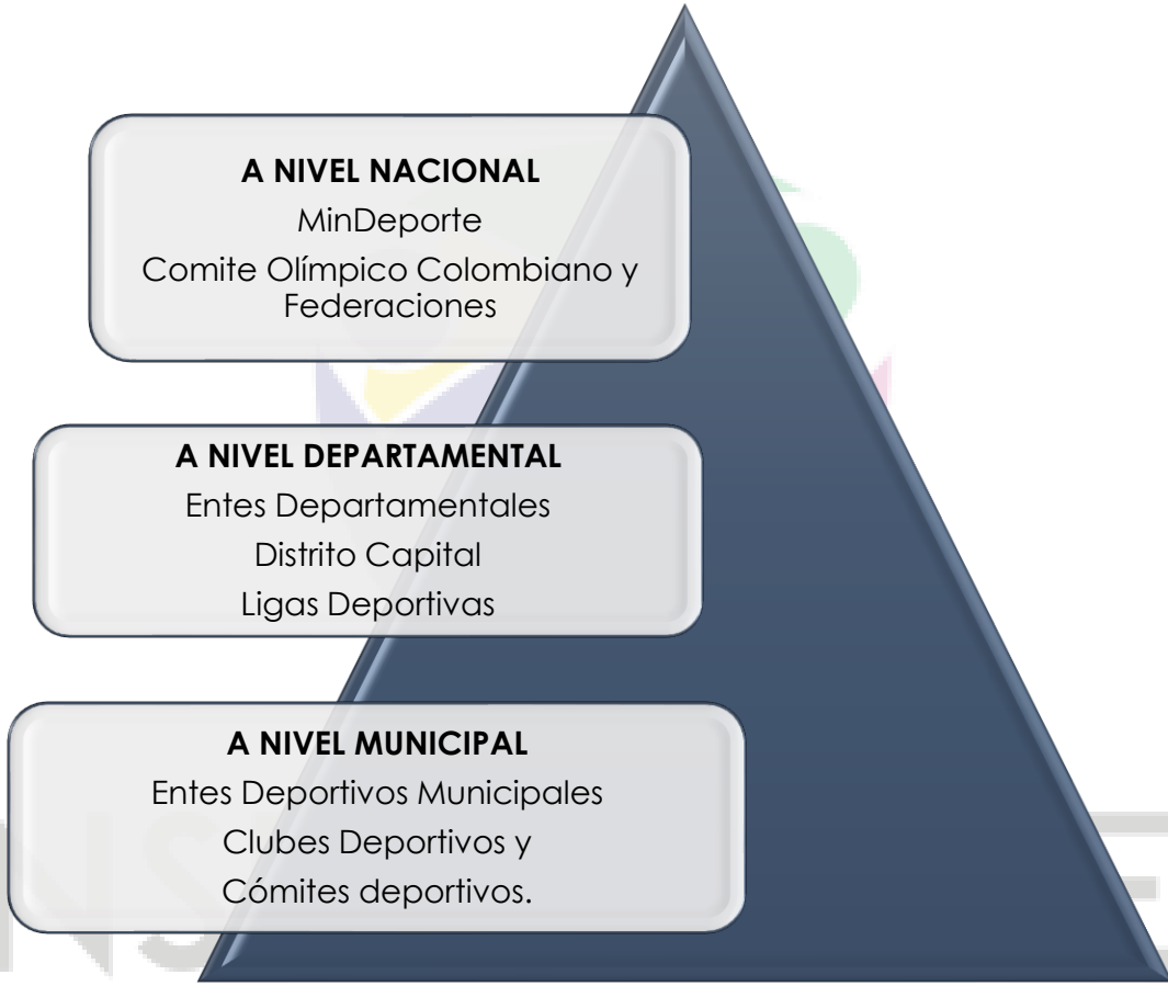
Ilustración 1- JERAQUIA SISTEMA NACIONAL DEL DEPORTE COLOMBIANO