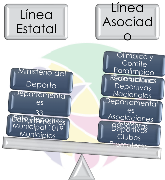
Ilustración 2- LÍNEA DE IMPLEMENTACIÓN DEL SISTEMA