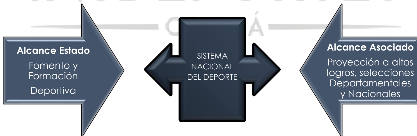
Ilustración 3- COMPARATIVO LÍNEAS DE ALCANCE