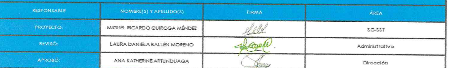
TABLA DE CONTROL DOCUMENTAL

Los firmantes, manifestamos expresamente que hemos estudiado y revisado el presente documento, y por encontrarlo ajustado a las disposiciones constitucionales, legales y reglamentarias vigentes, lo presentamos para su firma bajo nuestra responsabilidad.